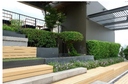
ภาพที่ 1.2-2 สภาพโครงการปัจจุบัน